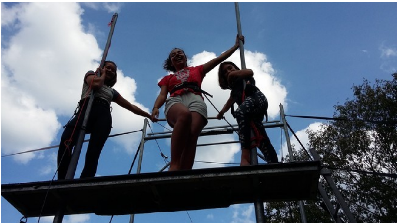
séance de découverte du trapèze volant pour les jeunes