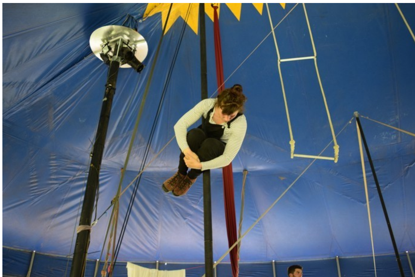
stage de mât chinois à Meyras