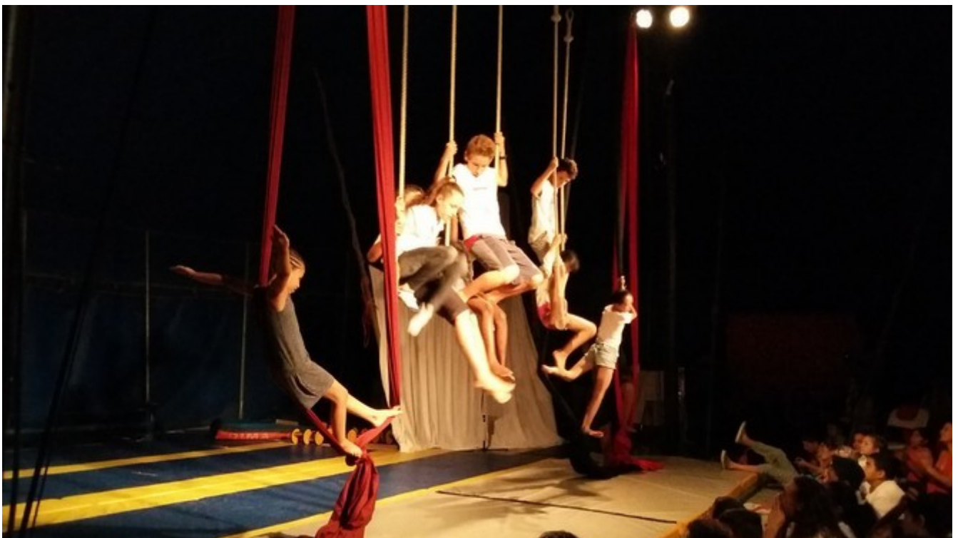
spectacle projet Copains du monde

Ici, tout est possible de ce qui est impossible dehors (Jacques PEUCHEMAURD)