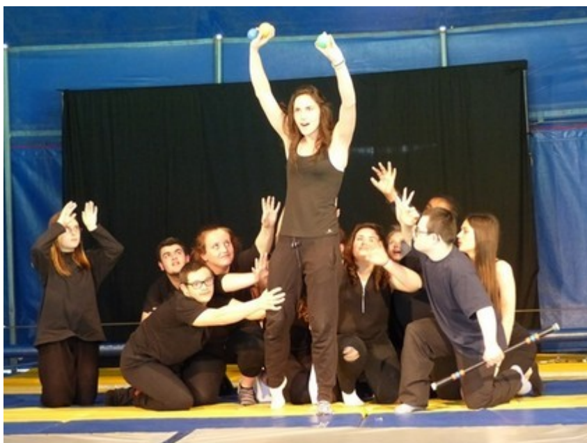
spectacle projet mixte IME Lalevade - lycée agricole d'Aubenas

Ainsi que les nombreux bénévoles qui ont participé aux missions logistique (montage et démontage de chapiteaux, trapèze volant, etc.)