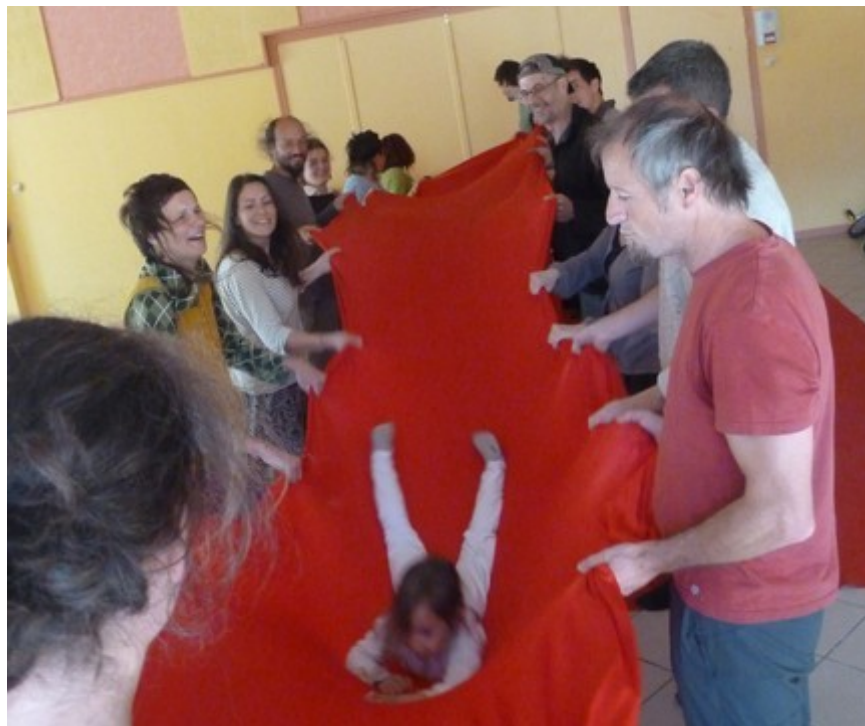
atelier parents-enfants à Ribes avec l'Ilot Zenfants